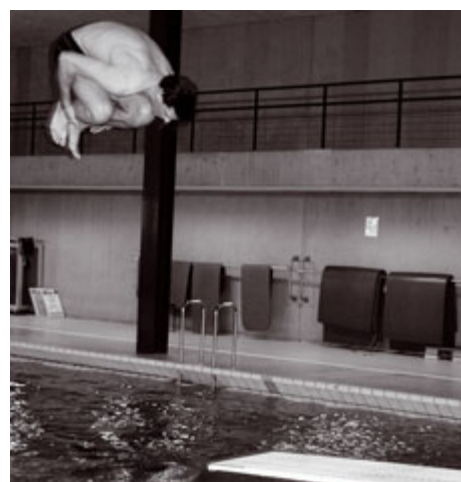
Impressionen aus dem SI-Kurs 2006, Teil 1