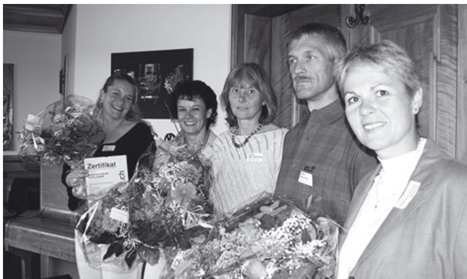
Übergabe der Zertifikate.