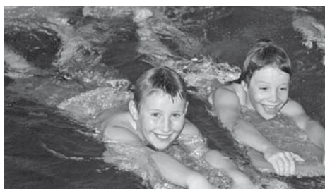
Wasser macht Spass!

Hier fungiert swimsports.ch als eine Anlaufstelle für Gemeinden, Schulbehörden, Kantone, PolitikerInnen, Schwimmunterrichtende, Eltern, Medien usw., die sich Gedanken zu diesen Themen machen und sich informieren möchten.